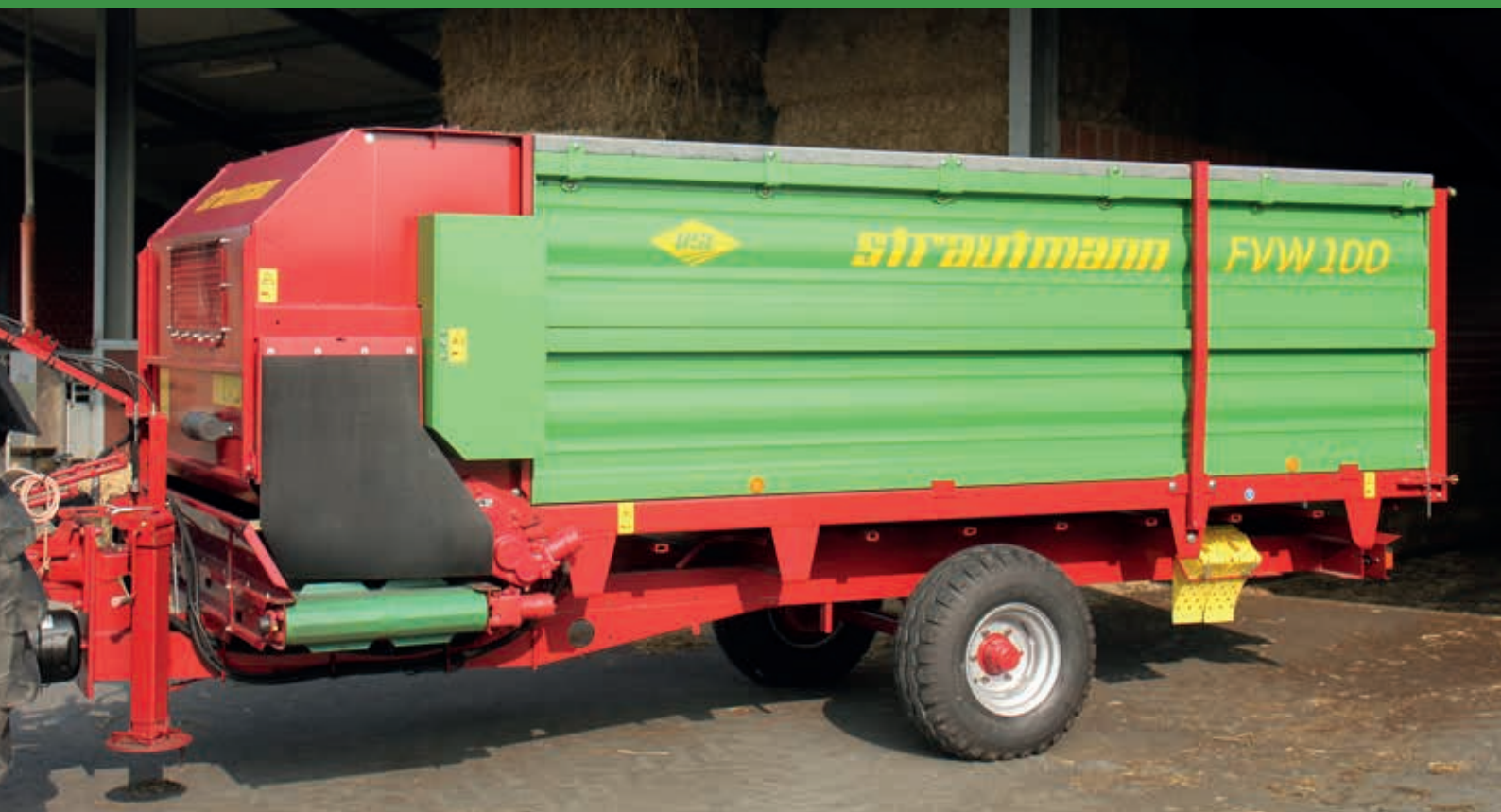
Remorque distributrice de fourrage