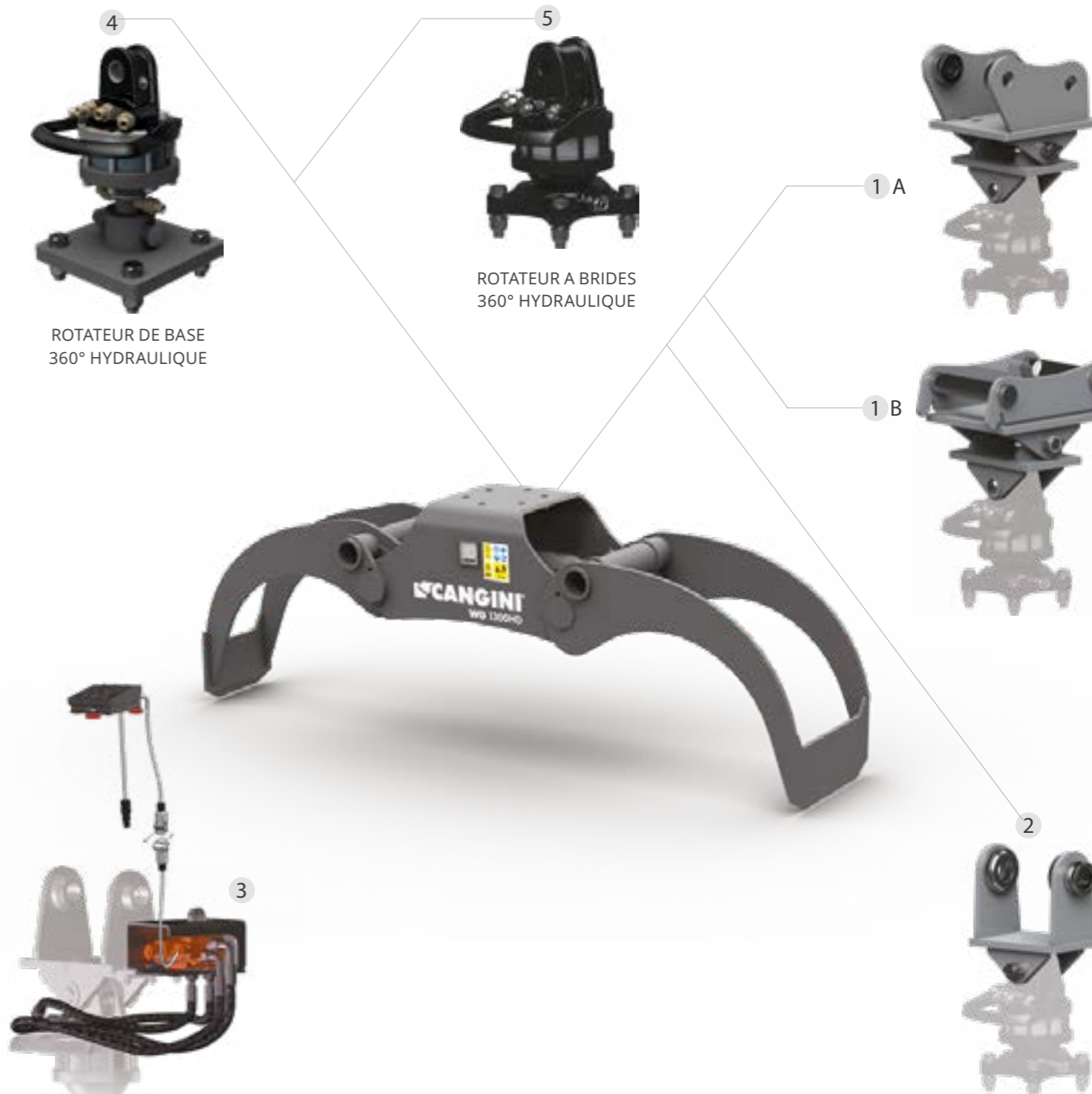
4 ROTATEUR DE BASE 360° HYDRAULIQUE