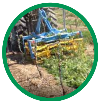
DESTRUCTION COUVERTS VÉGÉTAUX ROLL KROP