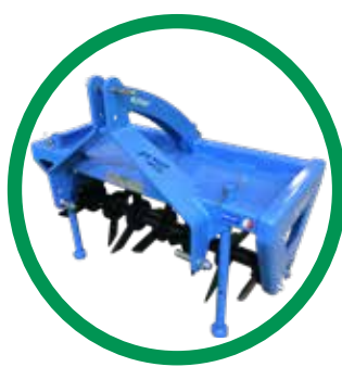
AÉRATION ENHERBEMENT ACTIFLORE