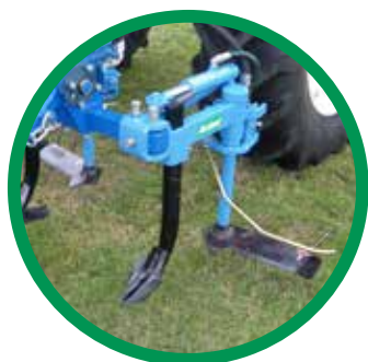
MONTAGE SUR ENJAMBEUR