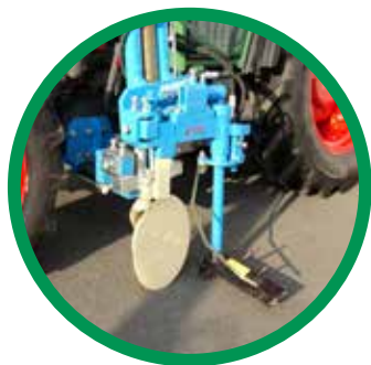
MONTAGE SUR TRACTEUR INTER-LIGNES