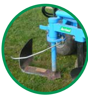
ACTICEP HYDROLAME AVEC LAME DÉCAVAILLONNEUSE